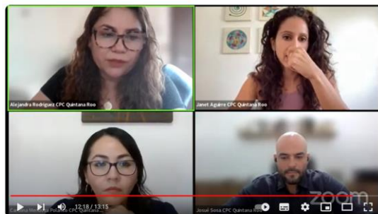
Primer sesión extraordinaria CPC periodo 2024-2025