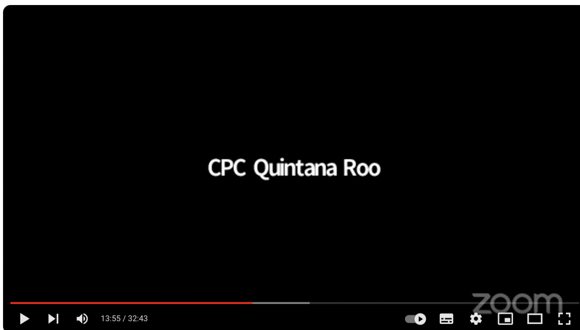
Sala de reuniones personales de CPC Quintana Roo