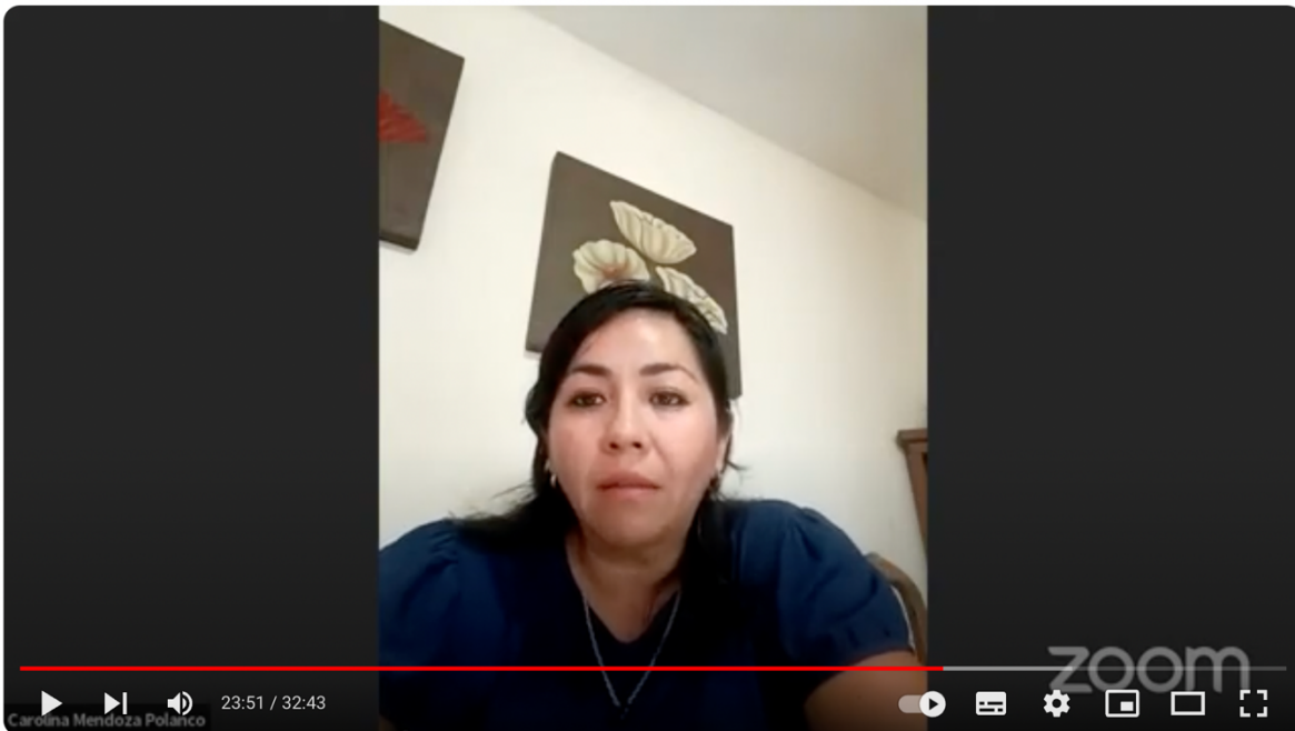
Sala de reuniones personales de CPC Quintana Roo